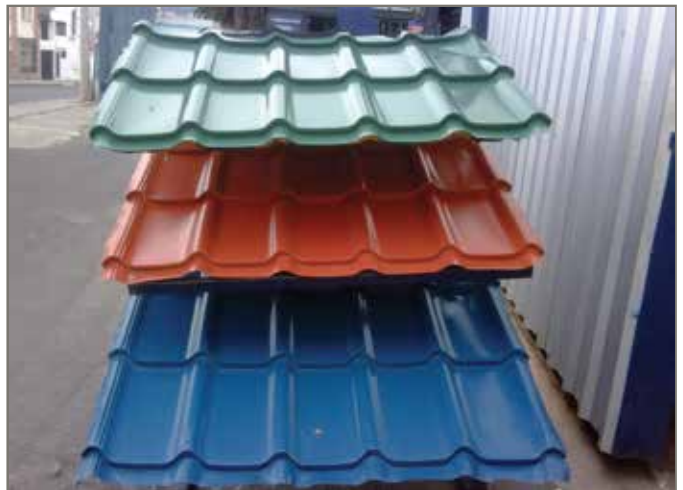
PANEL TIPO TEJA ROCIADO PUR