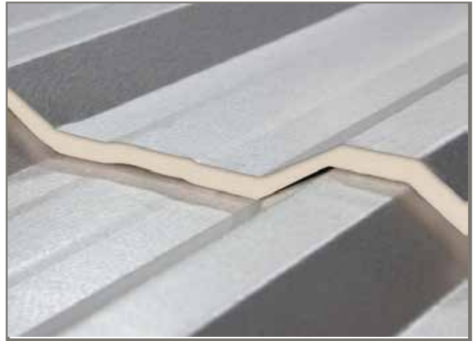
PANEL TRAPEZOIDAL ROCIADO PUR

Colores: Natural y Prepintado. Espesor Lámina : 0,30mm - 0,40mm Largo: A medida Ancho total : 1.07m Ancho útil: 1.00m Distancia entre correas : Depende de panel.